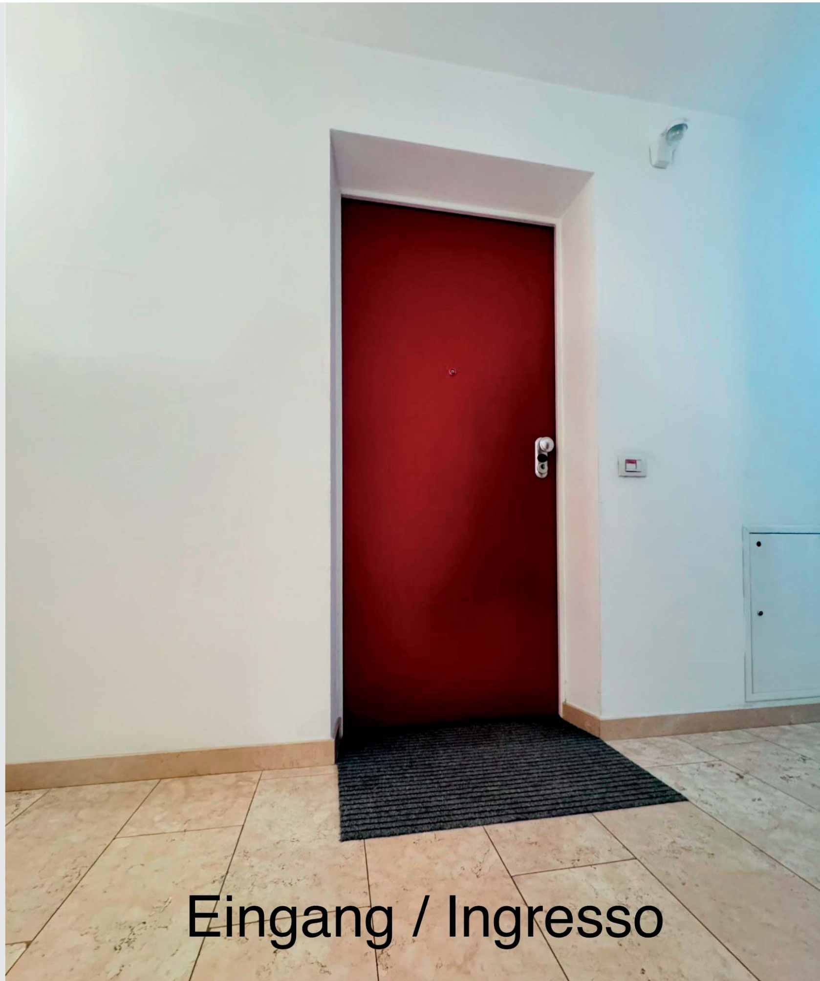
Eingang / Ingresso